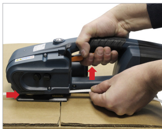
Inserimento della reggetta Insert strap