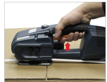
Sgancio della reggetta tramite leva Strap outfeed by handle