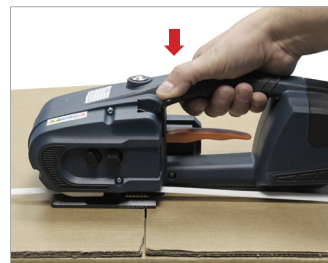
Saldatura tramite leva Welding by lever