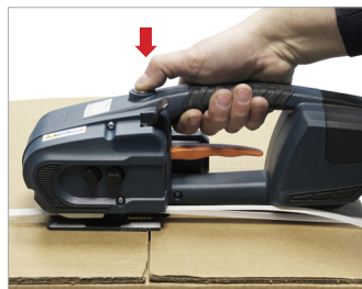
Tensionamento tramite pulsante Tensioning by button